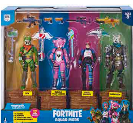
Pack com 4 figuras Fortnite

A Fortnite é o jogo de ação da Epic Games que permite que você entre em uma Batalha Real PVP massiva de 100 jogadores ou faça equipes com amigos em uma campanha de cooperação