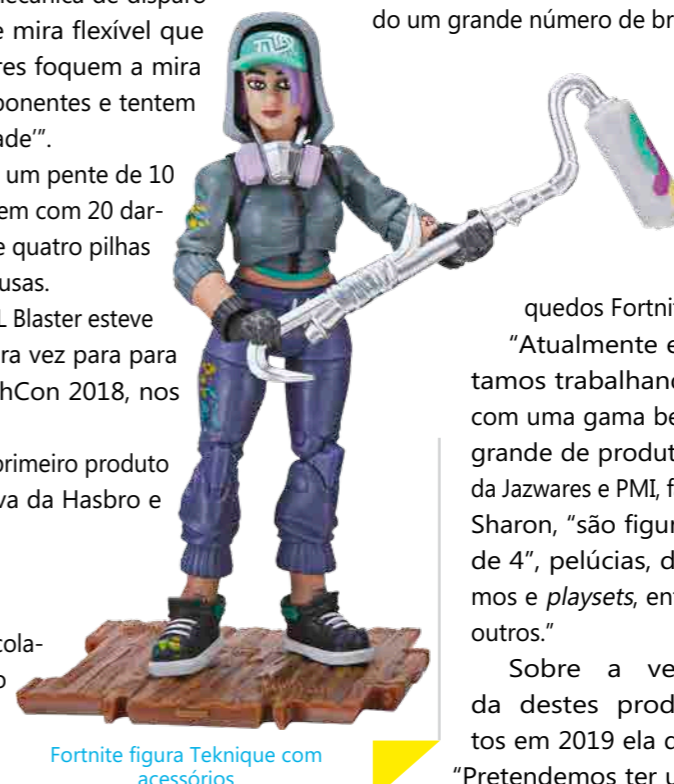
Fortnite figura Technique com acessórios

A Sunny Brinquedos está comercializando um grande número de brinquedos Fortnite.