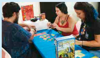
Game Show, espaço exclusivo dedicado a um mercado em ascensão, foi uma oportunidade de aprender mais sobre o fantástico universo dos jogos de tabuleiro

universo dos games, no mundo dos super-heróis e séries, e itens tão cobiçados em seu lançamento internacional que chegam às lojas brasileiras já este ano.