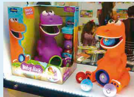
Baby Rex com bolinhas sonoras foi um dos 25 lançamentos de sucesso da Adijomar neste ano

Para encerrar, o diretor de projetos destacou os investimentos que a Adijomar Brinquedos tem feito. “Estamos ampliando as instalações (galpões) e aumentando e modernizando o parque fabril a cada ano”, fala Dalaneze.