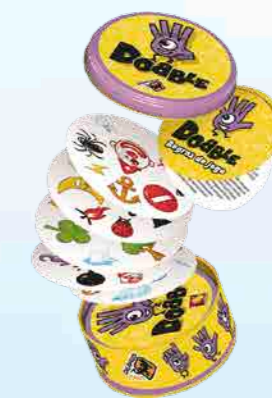
A Galapagos Jogos apresentou novidades exclusivas, como o Double

Estica e Puxa - Dino e Répteis: Com diferentes tipos de dinossauros e répteis, os brinquedos dessa linha são feitos de borracha, esticam e são gostosos de apertar, que os deixam mais divertidos ainda. E o melhor, são diversos modelos para colecionar e brincar. Princesas Mágicas: Essa linha chega repleta de glamour e delicadeza e é ideal para as meninas vaidosas. Amigo Robô - Desenvolvido com material de excelente qualidade, ele apresenta-se ao ligar e despede-se depois de um tempo parado. Fala três diferentes frases, mexe e pisca os olhos, aciona as luzes e a tela mostra imagens e desenhos de led cada vez que o robô interage. Tecladinho inteligente - Totalmente interativo e educativo, com ele as crianças aprendem brincando. Hoverball é um ótimo brinquedo para estimular a atividade física mesmo dentro de casa. Com o sistema airflow, a "bola" desliza sobre diferentes tipos de superfícies. Massinha e Areia, além de divertidas, a experiência de tocar, moldar e montar é super importante para coordenação motora dos pequenos. Sem falar que estimula a criatividade e a imaginação.