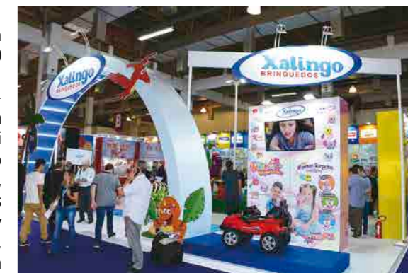
A Xalingo Brinquedos apresentou diversas novidades nesta edição da Abrin

Considerando a divisão licenciada (Angel Toys) e Divisão Não licenciada (Brinquedos Anjo) “chegamos com mais de 150 skus de lançamentos para a Abrin”, fala Teixeira. “Dentre os