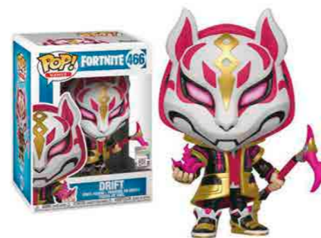
Fortnite Funko Pop Drift

para Salvar o Mundo contra uma hoste de monstros. Aja e obtenha recompensas em mundos gigantes onde não há dois mundos iguais. O Fortnite Battle