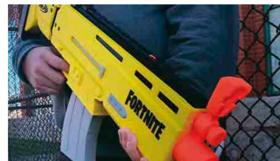
Primeira arma de brinquedo de Fortnite produzida pela Nerf é revelada

O Nerf Fortnite AR-L Blaster chega em 1º de junho de 2019, nos Estados Unidos. O produto tem uma mecânica de disparo rápido motorizado, e mira flexível que "permite que jogadores foquem a mira conforme eliminam oponentes e tentem sobreviver à 'Tempestade'".