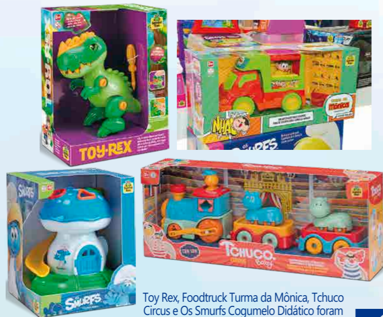
Toy Rex, Foodtruck Turma da Mônica, Tchuco Circus e Os Smurfs Cogumelo Didático foram alguns dos lançamentos da Samba Toys

Leite descreve os principais lançamentos da Samba Toys: “O Toy Rex é um dinô com mecanismo de som que acompanha uma chave de fenda para ser desmontado. Tchuco Circus é um trem com mecanis-