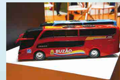
O lançamento Buzão da BS Toys

Desde o ano passado a empresa agregou a interatividade aos seus brinquedos, passando a oferecer aplicativos para experiências ao “brincar de carrinho”, através dos games para celulares e tablets.