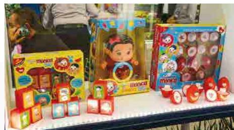
A nova licença da Turma da Mônica Baby presente dentre os lançamentos da empresa

“Notoriamente foi uma feira muito superior às edições anteriores, tanto na questão do aumento da visitação, quanto no otimismo dos