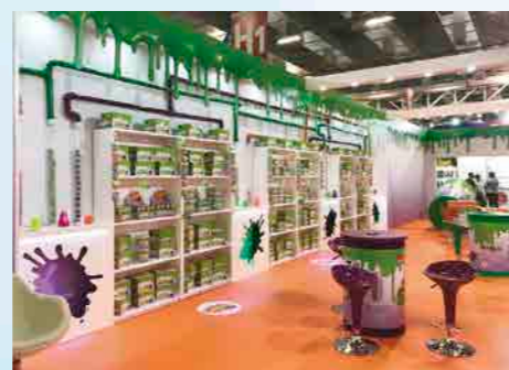
Detalhes do seu estande enfatizando sua premissa de não apenas expor, mas também permitir a experimentação frente a um novo conceito de brinquedo