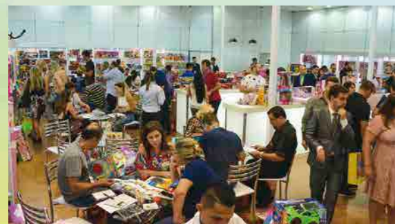
O estande da Samba Toys, Bee Toys e Milk Brinquedos esteve sempre muito movimentado

A Samba Toys que tem como princípios “Qualidade e tecnologia de