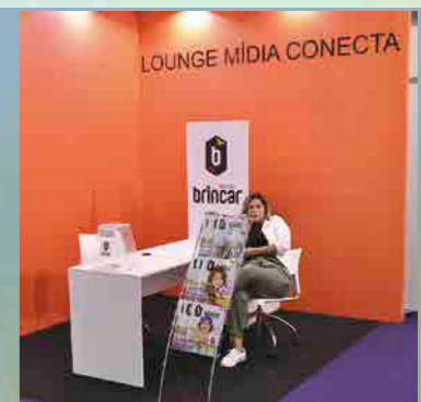
O espaço exclusivo da Revista Brincar foi mais uma das inovações da feira Abrin, criado pela Franca Feiras

Através de uma ideia inovadora de exposição, o Lounge Mídia Conecta, a publicação que busca a convergência digital, disponibilizando seu conteúdo, tanto impresso, quanto digitalmente, participou da 36ª Feira Internacional de Brinquedos - Abrin-2019. No evento, além de inúmeros contatos com seus clientes, a Revista Brincar teve a oportunidade de colocar à disposição dos seus leitores mais um número de sua edição bimestral.