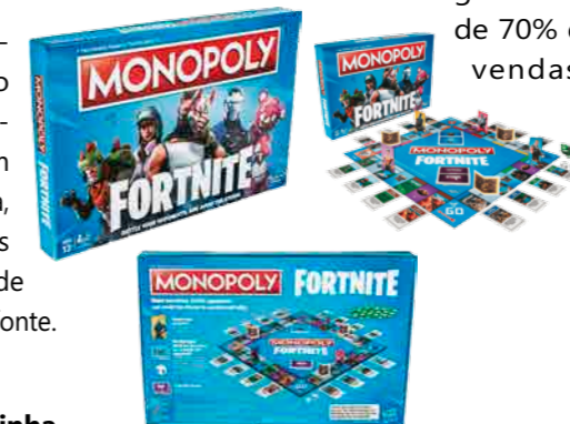
Monopoly Fortnite, da Hasbro

Sobre a venda destes produtos em 2019 ela diz: "Pretendemos ter um giro maior de 70% de vendas",