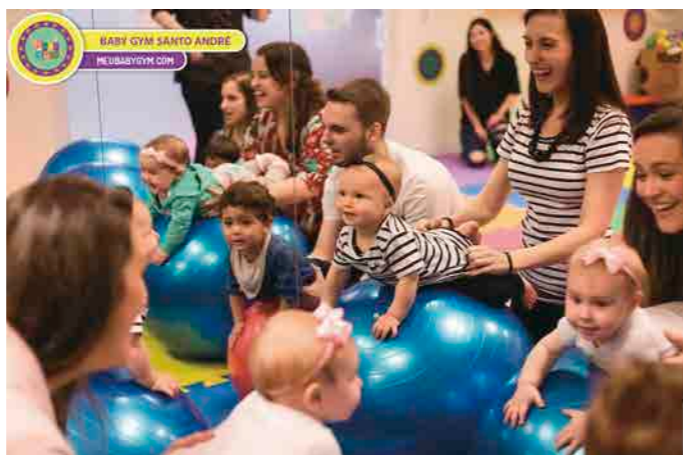
Pequenos incentivos durante atividades do dia a dia contribuem para o desenvolvimento físico, motor, psicológico e social das crianças

Segundo Canedo, o cérebro das crianças funciona como uma esponja durante a primeira infância, absorvendo todas as informações que recebe. Nesta fase, sobretudo até os 3 anos, os seres humanos desenvolvem