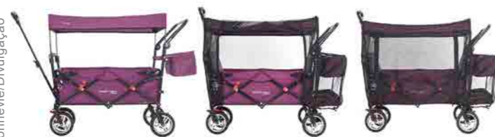
Pequenos incentivos durante atividades do dia a dia contribuem para o desenvolvimento físico, motor, psicológico e social das crianças

até duas crianças e conta com acessórios como mosquitoireiro e bolsa térmica.