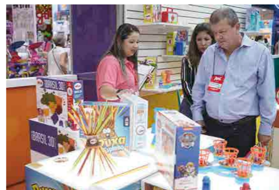
Comparadores dos quatro cantos do país, além de representantes estrangeiros, estiveram negociando com expositores da feira abrin

Só do clássico Monopoly a Hasbro trouxe três grandes novidades: Monopoly Chuva de Dinheiro, Monopoly Game of Thrones - muito aguardado pelos fãs da série - e Monopoly Fortnite (leia matéria na pag. 32 e 33 desta edição), entrando na onda mundial de sucesso do game.