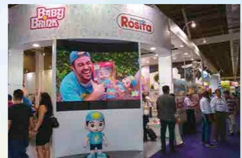
O telão na entrada do estande anunciava as novidades aos visitantes da Baby Brink/Rosita

Para os fãs, que em junho poderão conferir o filme “Turma da Mônica - Laços”, a Xalingo Brinquedos apresenta novidades como a Casinha Monte e Brinque, o Quebra-Cabeça para Colorir e os Colecionáveis.