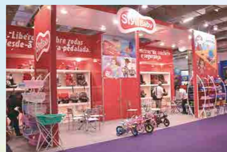
A Stylly Baby mostrou sua linha de produtos voltada para primeira infância

Para a brincadeira de 'casinha' a NIG traz peças super parecidas com as da mamãe nos lançamentos Fogão Gourmet e Kit Gourmet, nas