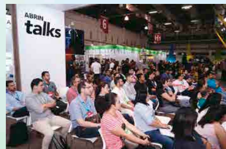
ABRIN Talks teve na programação temas como licenciamento, universo geek, visual merchandising, storytelling, varejo, marketplace, comércio digital e muitos outros

Para ampliar ainda mais as oportunidades de negócios, nos dias 19 e 20 a ABRIN realizou as Rodadas de Negócios. Em 153 encontros realizados entre 16 compradores e 54 empresas vendedoras o volume gerado de negócios foi de R$ 7,7 milhões nos