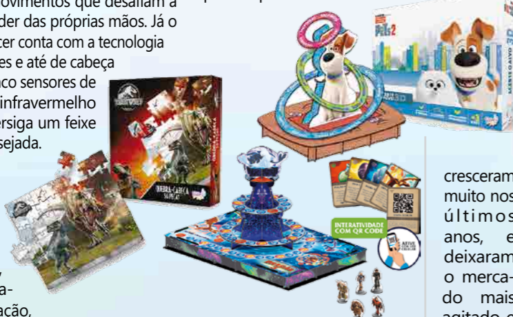
As novidades em cartoados como Aventura no mundo escondido, Quebra-cabeça Jurassic World 56 peças, Pets 2 foram apresentadas pela catarinense Positiva Legal

"A Abrin-2019 foi uma feira diferente. Os detalhes fizeram a diferença. Temos muitas empresas que