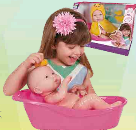
O lançamento Baby Ninos Banho

"Nós tivemos vários lançamentos, muito bom. Como a Lil' Cutesies, que são os bebezinhos com vários acessórios, marca que é da JC Toys, americana. São esculturas únicas, maravilhosas. Antes se comprava somente quem fosse para Orlando, nos Estados Unidos, mas nós trouxemos aqui no Brasil", fala Bazzo. "Tem o berçário que está hoje com a novidade do menino, roupas novas, carinhas novas e muito lindo nosso berçário. Temos também aqui a parte Cotiblock, que é uma linha nova de blocos,