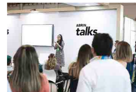
Abrin Talks foi onde os visitantes encontraram uma diversidade de outros conteúdos com temas inovadores

A grande aposta de "D.P.A. - Detetives do Prédio Azul" - uma das séries de maior sucesso do