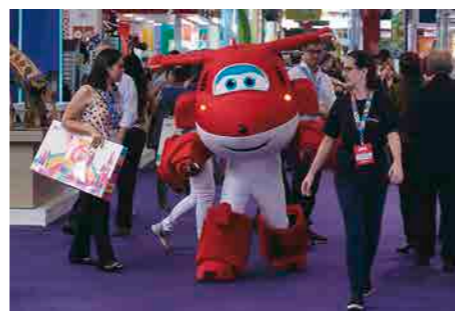
Marcas e personagens de licenciamento foram bem representados na principal feira do setor