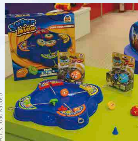
Super Pião, o brinquedo que é uma base com 4 lançadores de pião