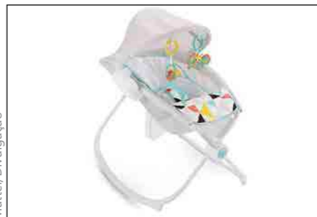
Berço de Balanço Rock'n Play Sleeper, da Fischer-Price

A medida também foi adotada nos Estados Unidos, pela Comissão de Segurança dos Produtos de Consumo, onde foram identificadas mais de 30 mortes de crianças relacionadas ao uso do produto. O berço de balanço, que pode simular movimentos leves permitindo um sono melhor, estava causando a queda dos bebês.