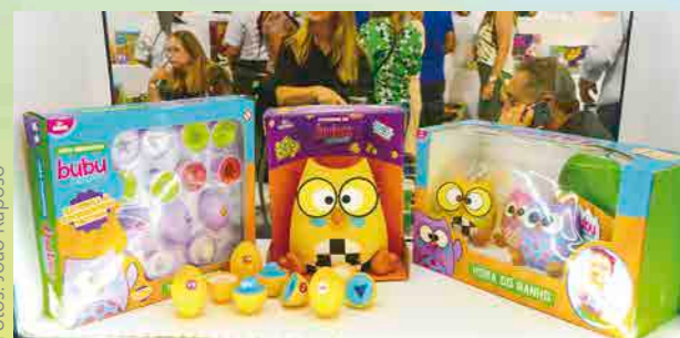
A licença bubu e as corujinhas ganharam novos brinquedos, como Jogo Educativo, Hora do Banho e Cofrinho

Nesta edição da feira Abrin, foram feitos 25 lançamentos, com destaque para: Linha de produtos da Turma da Mônica Baby com dispositivo de voz e música; Linha de produtos da Bubu e as corujinhas; Baby Rex com bolinhas sonoras; Casinha educativa e Boneca Yasmin