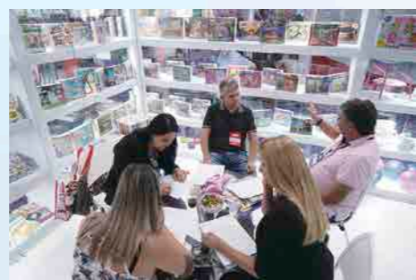
Muitos negócios e networking foram realizados durante a ABRIN

A biblioteca de direitos da empresa, avaliada em US $ 1,7 bilhão (em 31 de março de 2017), abrange todos os formatos de mídia e inclui mais de 80.000 horas de conteúdo de filmes e televisão e aproximadamente 40.000 faixas de música.