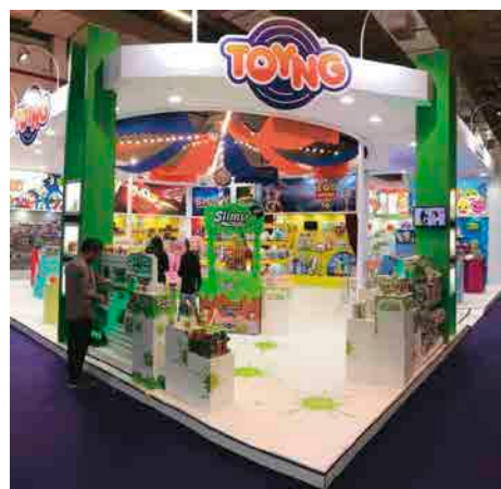
As colas, kits e slime Elmer's foram destaques no estande da Toyng

dos Sonhos, Carrssel de Peixe Voador e Roda Gigante, esses são alguns dos itens que compõem a linha inspirada na animação O Parque dos Sonhos. Para completar a lista de lançamentos, a Sunny apresenta a linha Air Hogs, composta por dois super produtos. O Supernova é um produto que permite fazer movimentos que desafiam a gravidade com o poder das próprias mãos. Já o Zero Gravity Laser Racer conta com a tecnologia para andar em paredes e até de cabeça para baixo. Possui cinco sensores de controle direcional infravermelho que faz com que persiga um feixe de luz na direção desejada.