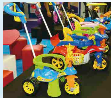
Os lançamentos na linha de triciclos Super Cross Azul e Rosa

Para nós, ser fabricante de brinquedos é muito mais que um negócio, mas sim uma paixão de três gerações, que buscam levar às crianças e às casas das famílias brasileiras a melhor qualidade e os melhores produtos para que possam ter cada vez mais momentos de alegria e união.