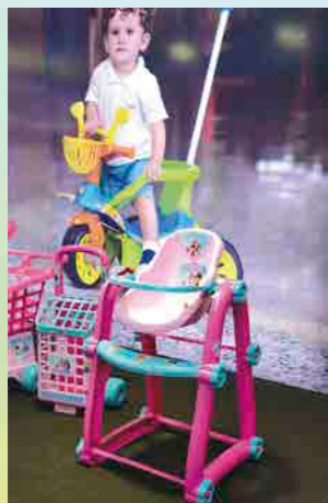
A nova cadeira de refeição Sonho Encantado foi destaque

O diretor presidente da Biemme do Brasil ainda destaca os investimentos que estão sendo