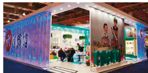
Calesita Brinquedos lançou mais de 3 produtos na feira Abrin-2019

cores vermelho e preto, com escorredorzinho de arroz e panela de pressão para oferecer diversão na cozinha. A linha postos, outro clássico da NIG, veio para a Abrin com peças em novas cores e embalagens atualizadas. São três modelos: Auto Posto, Super Posto e Acqua Posto. No segmento de tabuleiro, a NIG lançou Dia de Mesada com a Turma da Mônica ajudando a criança a lidar com seu dinheiro e aprender noções básicas de educação financeira. Outra novidade é o Fato ou Fake?, jogo com mais de 700 perguntas que vai testar o conhecimento da garotada ao questionar se é verdade ou não questões sobre Esportes, Tecnologia, Redes Sociais e muito mais.