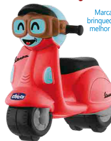
Marcas italianas se juntam para lançar brinquedos exclusivos que buscam juntar o melhor do mundo adulto automobilístico para o infantil.

consagrado da escuderia. Para escutar o motor de arranque e se sentir nas pistas, basta pressionar a cabeça do piloto. Já para quem gosta de velocidade, mas de maneira mais retro, os modelos da Vespa - nas cores vermelha, branca e amarela - funcionam por fricção e com rodinhas livres.