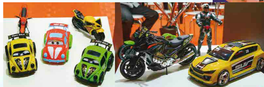
Um novo modelo de moto a fricção e carrinhos fazem parte dos lançamentos da BS Toys em 2019

“Procuramos diversificar nossa linha, de modo a oferecer uma maior variedade”, explica o diretor Ernica, que tem aproximadamente 180 referências em linha e que