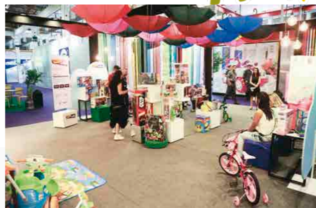
Arruma Loja: Instalação para orientar o lojista sobre as principais técnicas de Visual Merchandising: melhor exposição dos produtos para vender mais, atrair a atenção do consumidor e tornar a loja mais atrativa

Na categoria brinquedos a Entertainment One trabalha em parceria com grandes fabricantes, como: DTC, Elka, Estrela, Sunny, Grow,