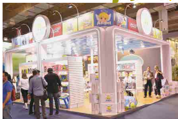
Angel Toys, a novíssima marca debutante na feira Abrin teve foco único e total nos brinquedos licenciados

Slime: O item mais exposto na feira. Mas nós temos o verdadeiro Slime Original. Ele não quebra, estica, não gruda na roupa, sofá, carpete,