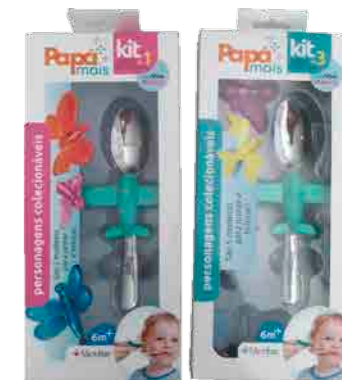
A linha Papá+ foi desenvolvida para tornar a difícil missão de tornar a hora de comer mais agradável e divertida!

Essa é uma nova versão do "olha o aviãozinho" que sempre encantou as crianças.