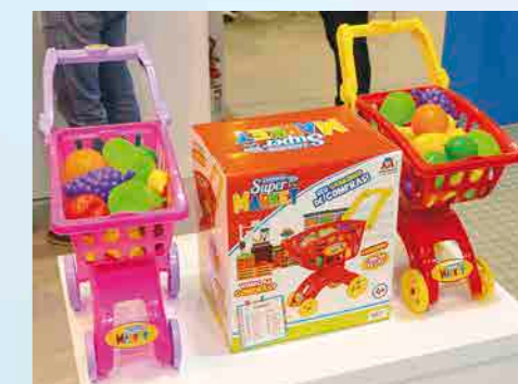
Carrinho Super MARKET com frutinhas é diversão garantida para a meninada

Brasil todo, através da rede de representantes e vendedores que satisfaçam ao consumo no mercado nacional. Buscando sempre inovar, conta com um departamento de SAC, onde atende diretamente os consumidores para esclarecimentos dos produtos, recebimento de críticas e sugestões.